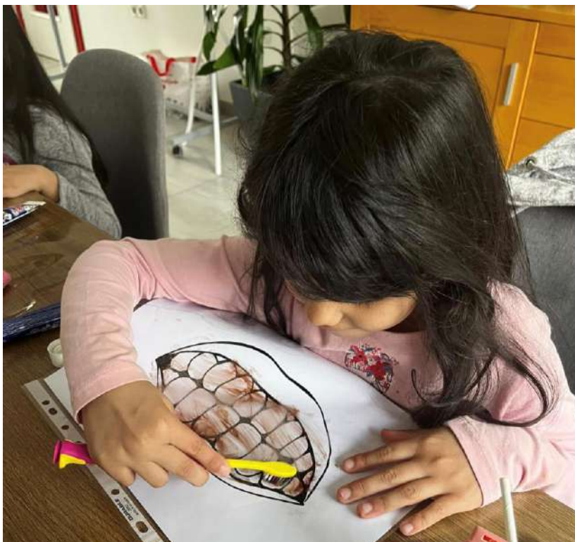
Slika 19 Radionica o važnosti osobne higijene, pravilnog pranja ruku i zubi s djecom romske nacionalne manjine 2025. godine

Tijekom 2025. godine maturanti su educirani o važnosti dobrovoljnog davanja krvi kroz šest radionica održanih u Srednjoj školi Valpovo, u kojima je sudjelovalo 87 učenika, dok je na temu prevencije ovisnosti provedeno 16 radionica s ukupno 290 sudionika. Povodom Svjetskog dana zdravlja, u okviru projekta „Snažni i jednaki“, koji se provodio s romskom djecom i ženama, s djecom je održana radionica o važnosti osobne higijene, pravilnog pranja ruku i zubi.