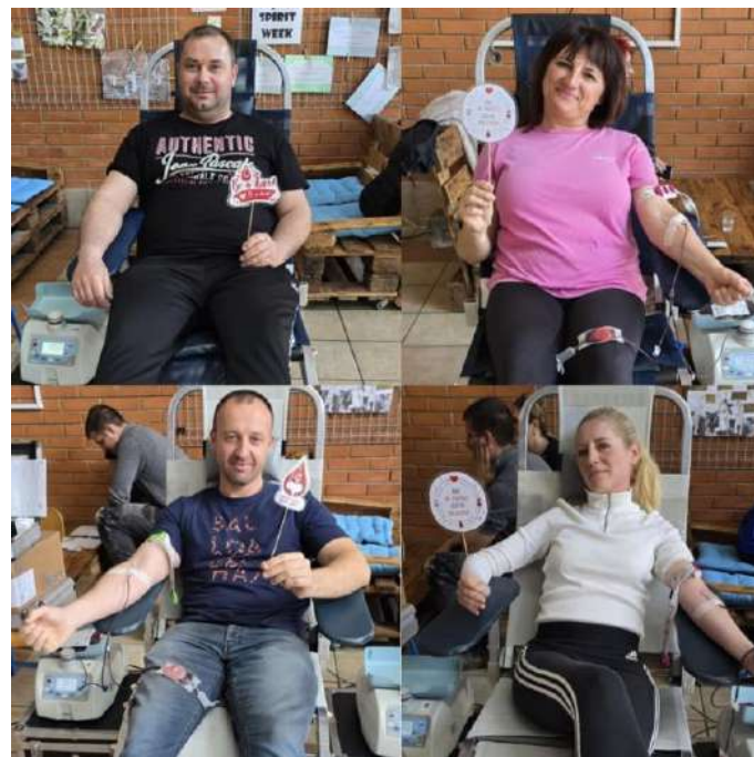
Slika 12 Akcije DDK u Petrijevcima

Akcije dobrovoljnog davanja krvi održavale su se na sljedećim lokacijama: DVD Belišće, Osnovna škola Ladimirevci, Osnovna škola Petrijevci, Lječilište Bizovačke toplice, Srednja škola Valpovo te Crveni križ Valpovo.