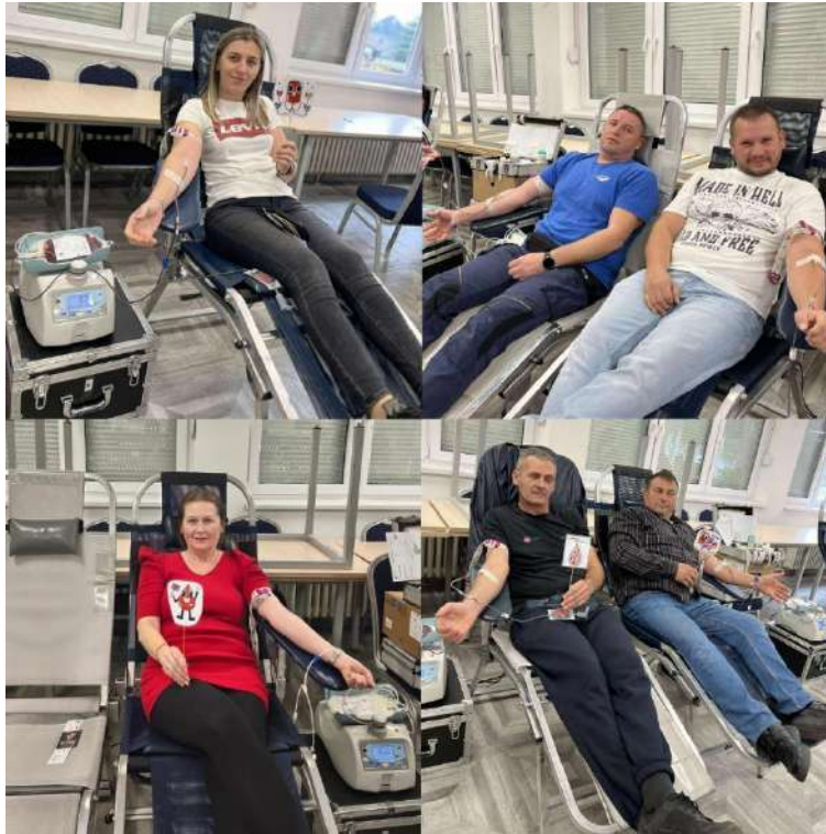
Slika 14 Akcija DDK u Belišću

Hrvatski Crveni križ Gradsko društvo Crvenog križa Valpovo, povodom Dana dobrovoljnih davatelja krvi u Republici Hrvatskog – 25. listopada, svake godine, tradicionalno organizira prigodnu svečanost. Prema Pravilniku o priznanjima Hrvatskog Crvenog križa koji je donesen na temelju članka 39. Statuta Hrvatskog Crvenog križa, dodjeljuju se priznanja Hrvatskog Crvenog križa za višestruko danu krv.