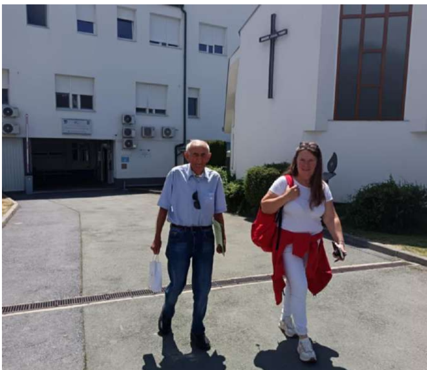
Slika 46 Mobilni u nas - Crveni križ Valpovo

Projekt se provodi uz financijsku podršku Ministarstva rada, mirovinskog sustava, obitelji i socijalne politike, u partnerstvu s lokalnim jedinicama vlasti, a korisnici ga koriste redovito, uključujući i situacije kada volonteri GDCK Valpovo pružaju dodatnu pomoć pri dolasku i odlasku. Kroz ovu uslugu, Crveni križ osigurava da starije osobe imaju siguran, pouzdan i prijateljski pristup potrebnim uslugama, čime se jača njihova povezanost s lokalnom zajednicom i osjećaj sigurnosti. Tijekom 2025. godine 190 korisnika je koristilo uslugu prijevoza.