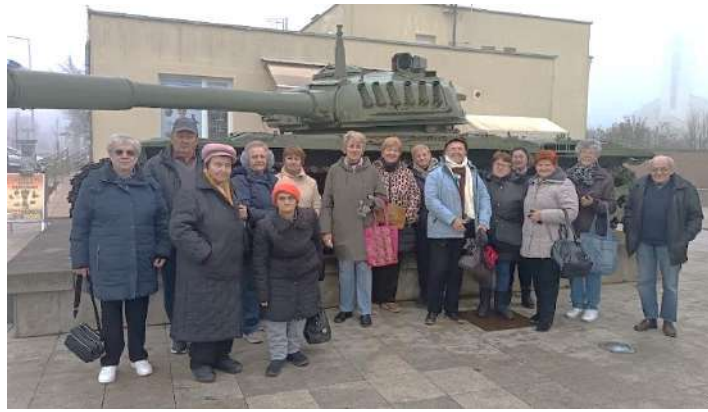
Slika 33 Korisnici Dnevnog boravka Crvenog križa Valpovo ispred tenka kod Spomen doma hrvatskih branitelja na Trpinjskoj cesti