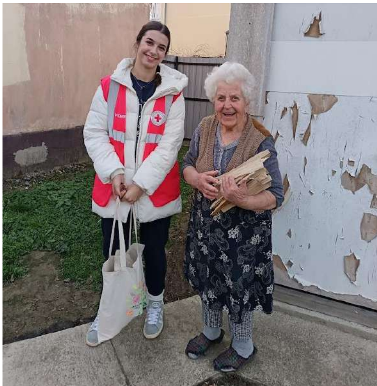
Slika 42 Podjela paketa

Distribucija humanitarne pomoći provodi se u skladu s raspoloživim sredstvima i stvarnim potrebama korisnika, čime se osigurava da svaka pomoć dođe onima kojima je najpotrebnija. Ovaj sustavni pristup omogućava učinkovitu raspodjelu i maksimalni učinak pružene podrške.