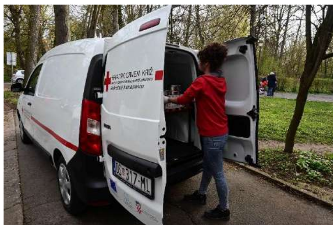
Slika 37 Dostava kuhanih obroka