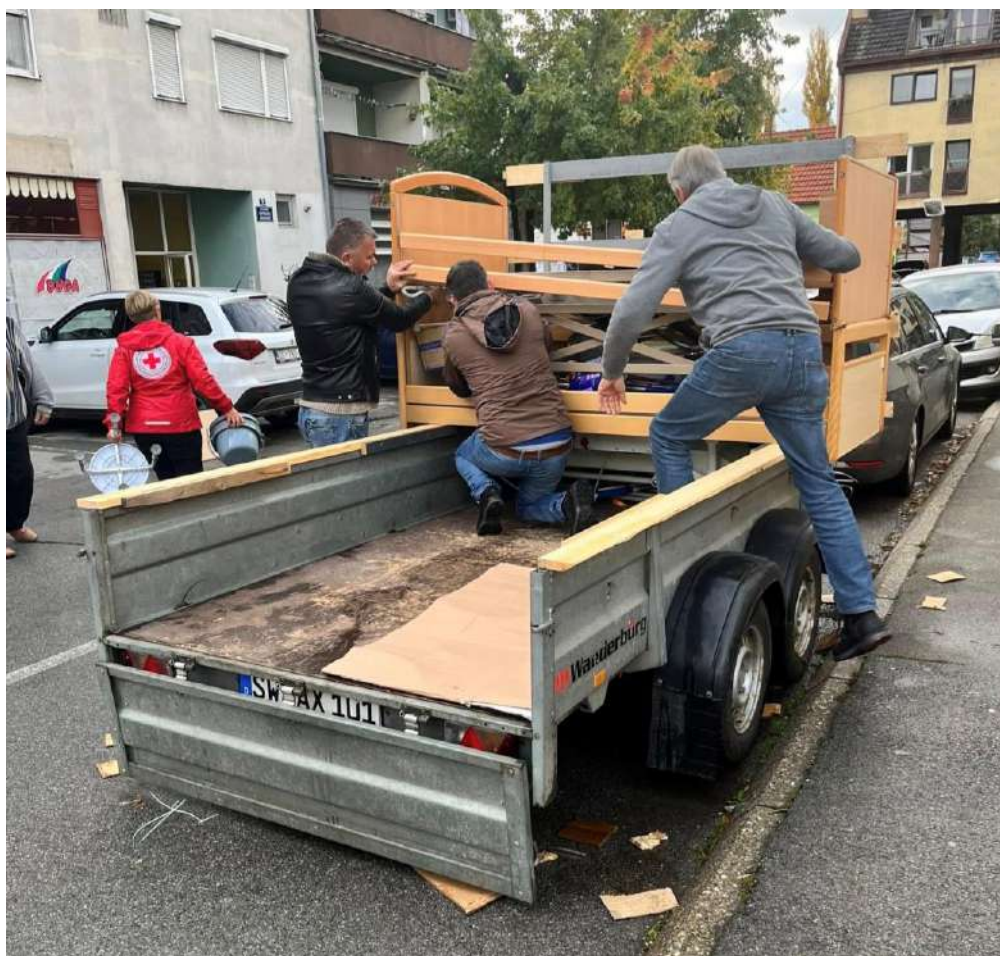
Slika 20 Istovar donacije ortopedskih pomagala 2025. godine

Tijekom 2025. godine broj aktivnih volontera u GDCK Valpovo je 83 od čega su 72 žene i 11 muškaraca. Volontera u dobi do 14 godina bilo je 7, u dobi od 15 do 17 godina 38, u dobi od 18 do 30 godina 29, u dobi od 31 do 45 godina 4, u dobi od 46 do 65 godina 3 te u dobi od 66 godina i više 2 volontera.