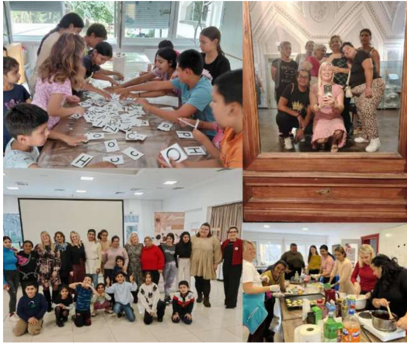
Slika 49 Aktivnosti u okviru projekta "Snažni i jednaki"