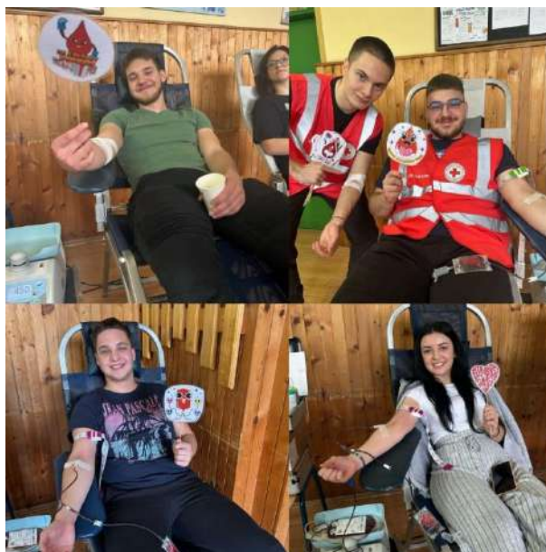
Slika 10 Akcija DDK Srednja škola Valpovo, 1. travnja 2025. godine

Promidžba i najave akcija obavljaju se putem: dopisnica, plakata, obavijesti u svim župama s područja Valpovštine na nedjeljnim misama, preko povjerenika i predsjednika mjesnih osnovnih društava Crvenog križa, mladih Crvenog križa, preko učenika u školama te obavijestima na službenim stranicama SŠ Valpovo.