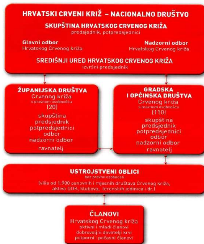
Slika 3 Ustroj i tijela HCK, Glasilo HCK