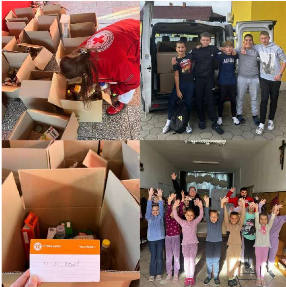
Slika 40 Solidarnost na djelu 2025.