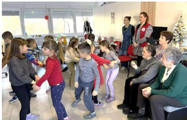
Slika 30 Druženje uz pjesmu i ples djece iz Dječjeg vrtića „Maza“ u Valpovu i korisnika Dnevnog boravka Crvenog križa Valpovo

Uspješna suradnja sa projektom Dnevni boravak – Crveni križ Valpovo ostvaren je i sa Dječjim vrtićem „Maza“ Valpovo, gdje su nas mališani iz vrtičke skupine „Bombončići“, posjetili i razveselili pjesmom, plesom i osmjesima čak tri puta, a i naši korisnici su ih iznenadili sa poklonima - ručno izrađenim štrikanim igračkama. Ove aktivnosti su doprinijele međugeneracijskoj suradnji i osjećaju pripadnosti starijih osoba, uz obostrane emocionalne dobrobiti i jačanju socijalnih veza.