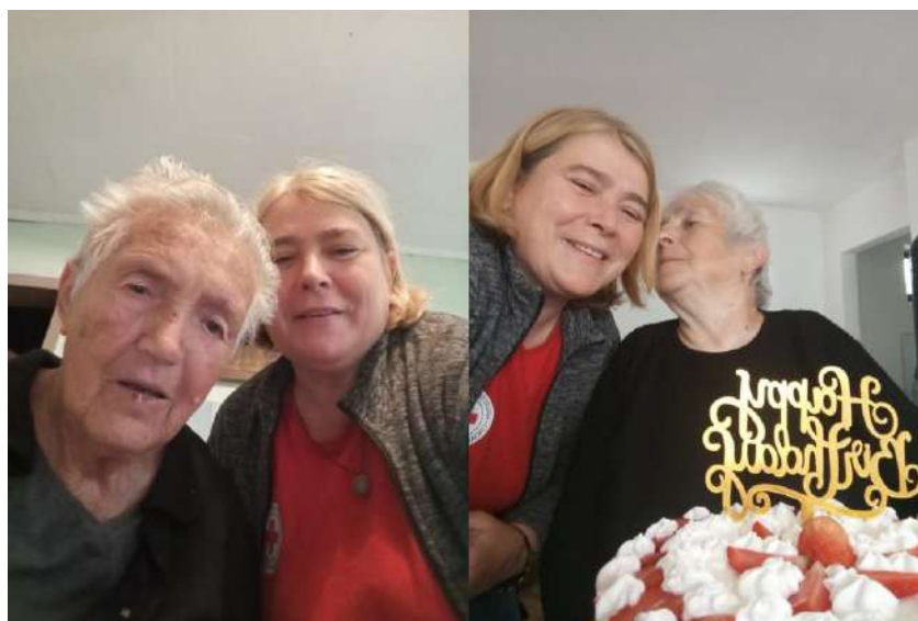
Slika 43. Korisnice i gerontodamacica projekta Zaželi - Prevencija institucionalizacije.