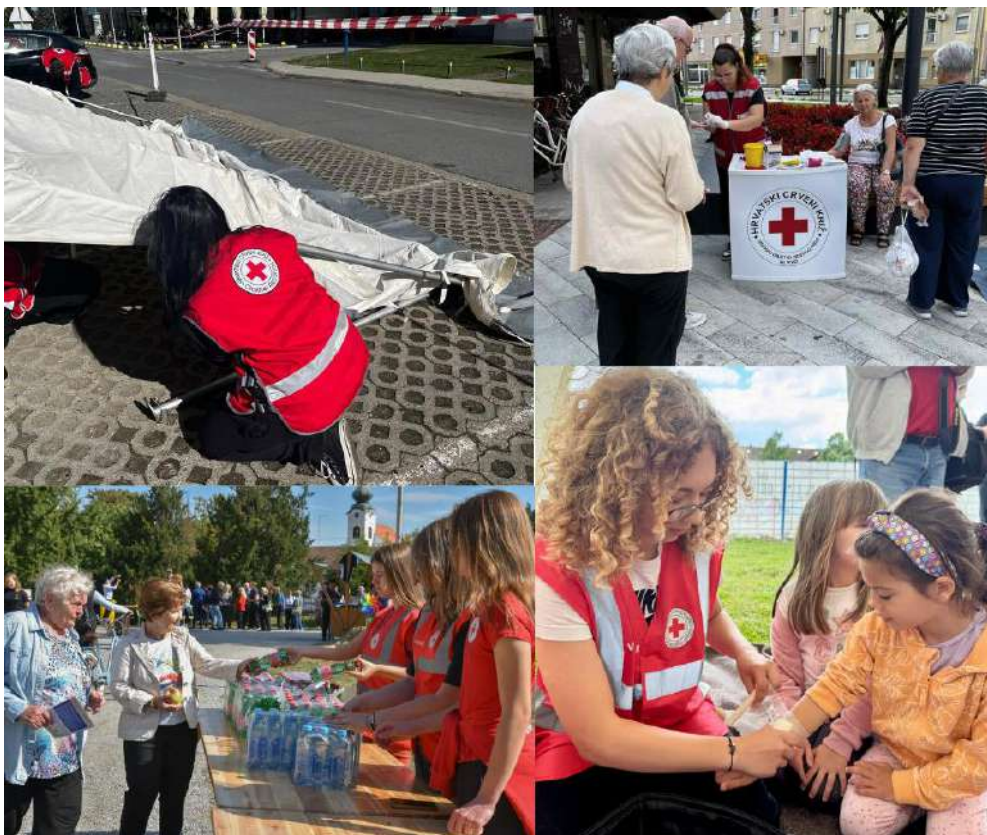
Slika 23 Aktivnosti Kluba mladih GDCK Valpovo u 2025. godini