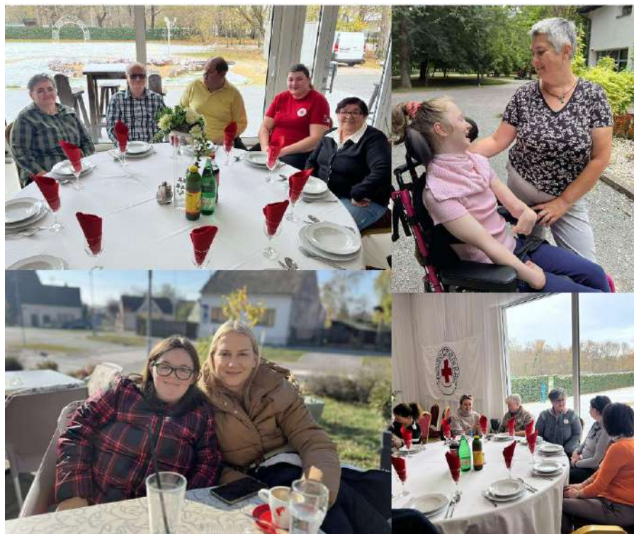
Slika 50 Zaposlenice i korisnici projekta "Snaga podrške - Crveni križ Valpovo"