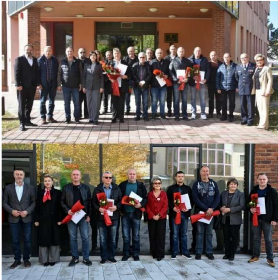
Slika 16 Svečanost, 2025. godine, povodom Dana dobrovoljnih davatelja krvi u RH - 25. listopad

Red Danice hrvatske je odlikovanje Republike Hrvatske koje zauzima četrnaesto mjesto u važnosnom slijedu hrvatskih odlikovanja. Red je ustanovljen 10. ožujka 1995. godine. Red se dijeli na sedam jednako vrijednih odlikovanja, a dobrovoljnim darivateljima krvi uručuje se Red Danice hrvatske s likom Katarine Zrinske – dodjeljuje se hrvatskim i stranim državljanima za osobite zasluge za zdravstvo, socijalnu skrb i promicanje moralnih društvenih vrednota.