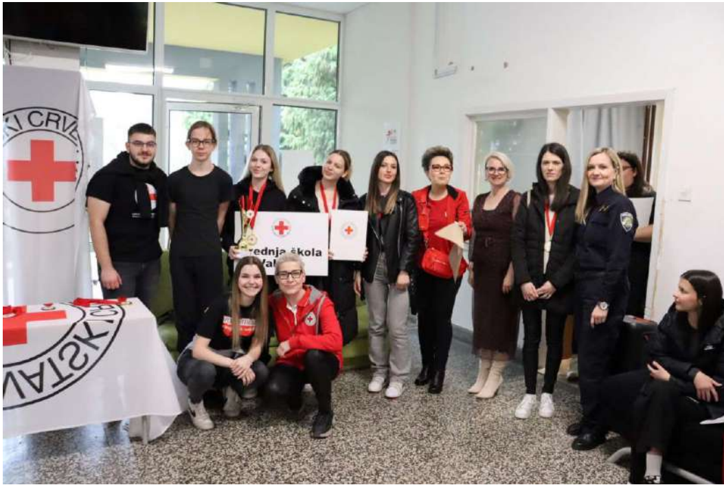
Slika 26 Ekipa u kategoriji mladih SŠ Valpovo s mentoricom na Gradskom natjecanju mladih HCK 2025. godina

Na međužupanijskoj razini koja je održana 12. travnja 2025. godine u Slatini, ekipa Srednje škole Valpovo osvojila je 3. mjesto u kategoriji mladih dok je ekipa OŠ Ladimirevci osvojila 3. mjesto u kategoriji podmlatka.