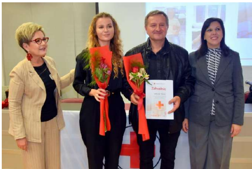
Slika 15 Obiteljska zahvalnica

Hrvatski Crveni križ Gradsko društvo Crvenog križa Valpovo, povodom Dana dobrovoljnih davatelja krvi u Republici Hrvatskog – 25. listopada, svake godine, tradicionalno organizira prigodnu svečanost. Prema Pravilniku o priznanjima Hrvatskog Crvenog križa koji je donesen na temelju članka 39. Statuta Hrvatskog Crvenog križa, dodjeljuju se priznanja Hrvatskog Crvenog križa za višestruko danu krv.