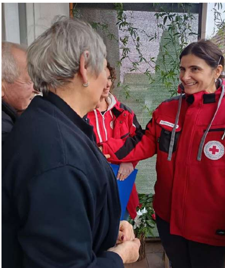
Slika 36 Pomoć u kući