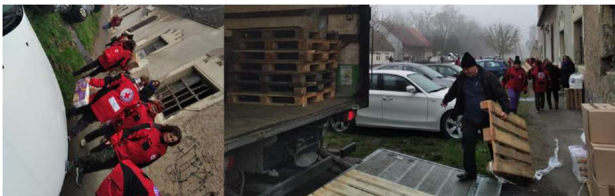
Slika 44. Podjela paketa kućanskih potrepština, Zaželi - Prevencija institucionalizacije.