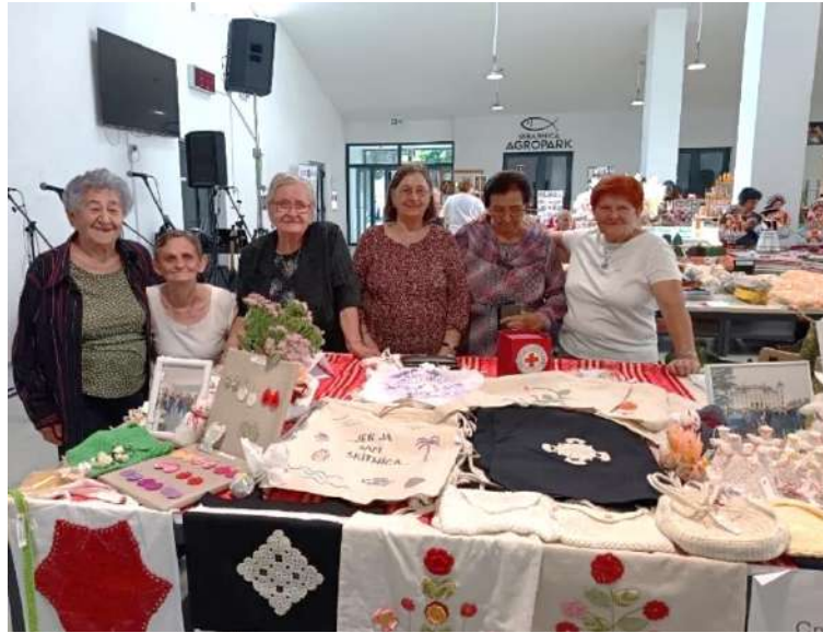
Slika 31 Korisnici Dnevnog boravka Crvenog križa Valpovo i njihovi radovi izloženi na 19. valpovačkom sajmu obrtništva i malog poduzetništva 20. rujna 2025.

Također, voditeljica Dnevnog boravka organizirala i dvije edukativne eko - radionice. Povodom Dana planeta Zemlje održana je radionica izrade eko omekšivača za rublje, dok je povodom Svjetski dan zaštite okoliša organizirana radionica izrade prirodnog deterdženta za rublje. Kroz radionice, uz savjete i recepte korisnici su se informirali i potaknuli na izradu vlastitih prirodnih i ekoloških sredstava za pranje rublja, koja su pohranjena u ponovno upotrijebljenoj plastičnoj ambalaži, čime se potaknulo na ponovno korištenje plastike i na smanjenje nepotrebnog otpada.