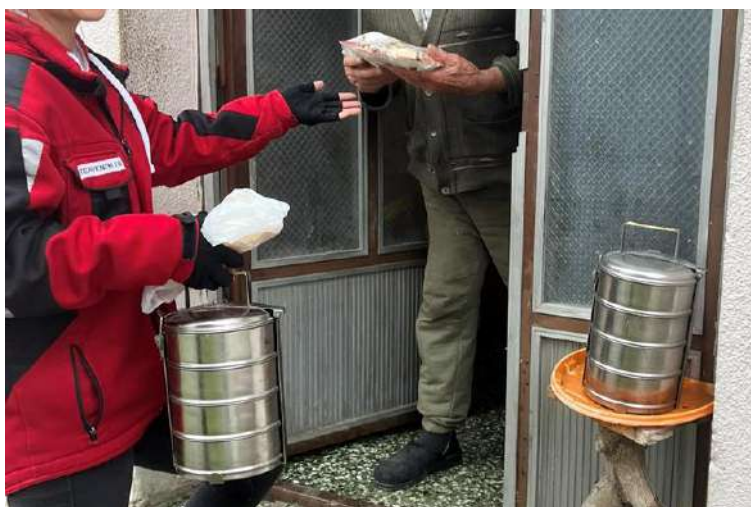
Slika 38 Dostava kuhanih obroka