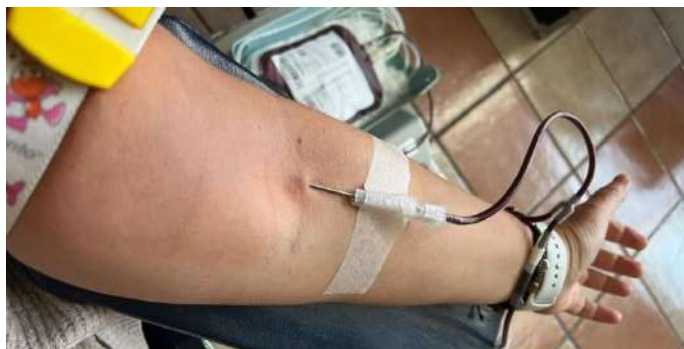
Slika 9 Dobrovoljno davanje krvi