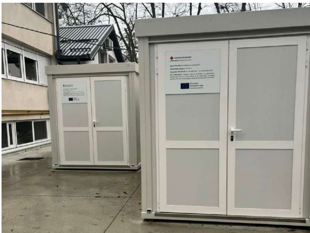
Slika 48 Kontejneri u sklopu projekta "HRANA SOLIDARNOSTI"