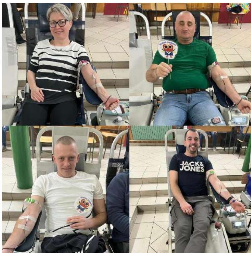
Slika 13 Akcija DDK u Ladimirevcima

Tijekom 2025. godine GDCK Valpovo organiziralo je i provelo 26 akcija dobrovoljnog davanja krvi. U sljedećoj tablici je moguće vidjeti planirani i ostvareni broj darivatelja po mjestima održavanja akcija darivanja krvi.