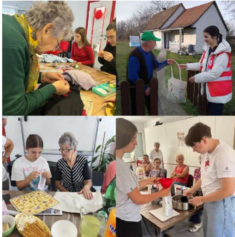
Slika 51 Aktivnosti "Eko-generacije - zajedno za održivu budućnost"