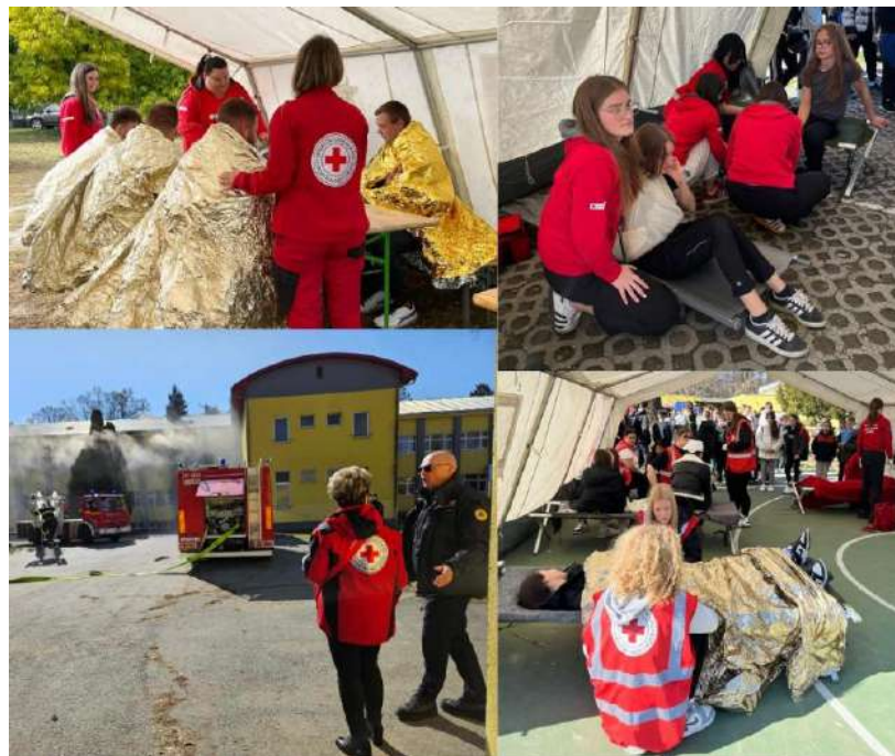
Slika 5 Pokazna vježba u kojima je tijekom 2025. godine sudjelovalo GDCK Valpovo