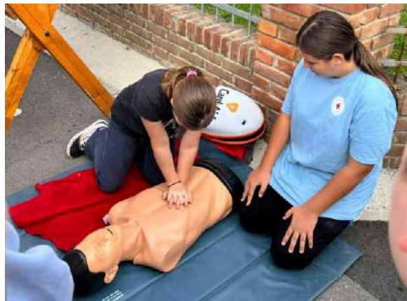
Slika 7 Svjetski dan prve pomoći