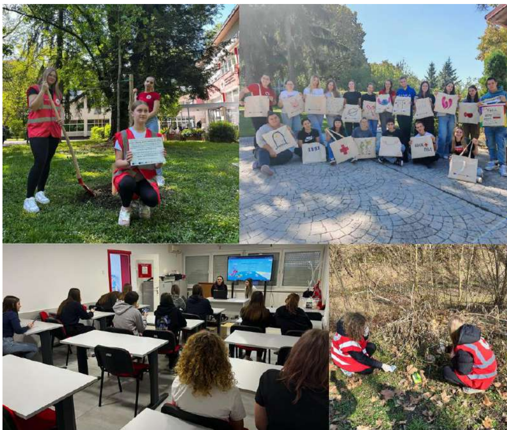
Slika 45 Aktivnosti u okviru projekta "Educiraj, prenesi, zelenije sutra donesi"