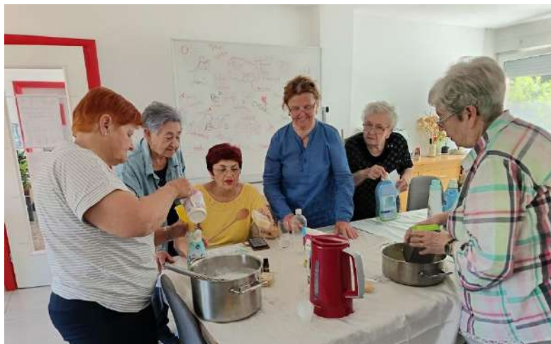
Slika 32 Edukativna radionica izrade domaćeg eko deterdženta za pranje rublja

Također, voditeljica Dnevnog boravka organizirala i dvije edukativne eko - radionice. Povodom Dana planeta Zemlje održana je radionica izrade eko omekšivača za rublje, dok je povodom Svjetski dan zaštite okoliša organizirana radionica izrade prirodnog deterdženta za rublje. Kroz radionice, uz savjete i recepte korisnici su se informirali i potaknuli na izradu vlastitih prirodnih i ekoloških sredstava za pranje rublja, koja su pohranjena u ponovno upotrijebljenoj plastičnoj ambalaži, čime se potaknulo na ponovno korištenje plastike i na smanjenje nepotrebnog otpada.