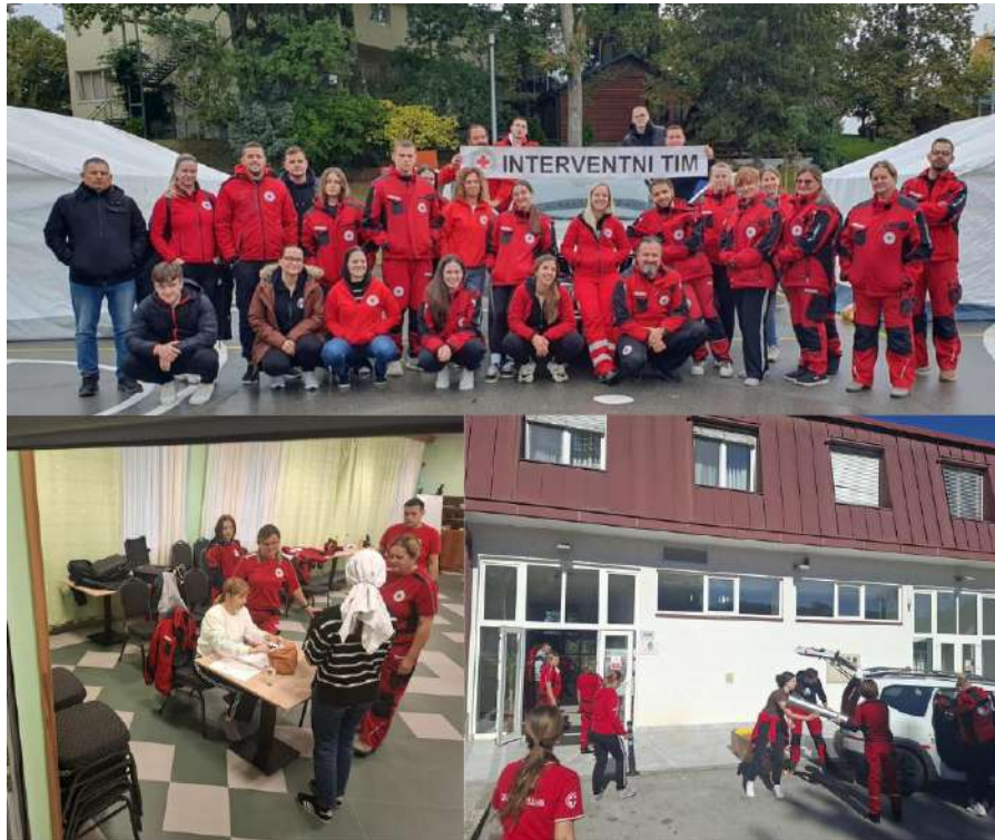
Slika 6 Edukacija za članove Osnovne jedinice interventnog tima DCK OBŽ 2025. godine

Tijekom 2025. godine, volonteri i zaposlenici GDCK Valpovo sudjelovali su na edukacijama za sudjelovanje u međunarodnim operacijama civilne zaštite, edukaciji za članove Osnovne jedinice interventnog tima Društva Crvenog križa Osječko-baranjske županije, treningu za trenere terenske jedinice mladih i treningu za članove terenske jedinice mladih GDCK Valpovo.