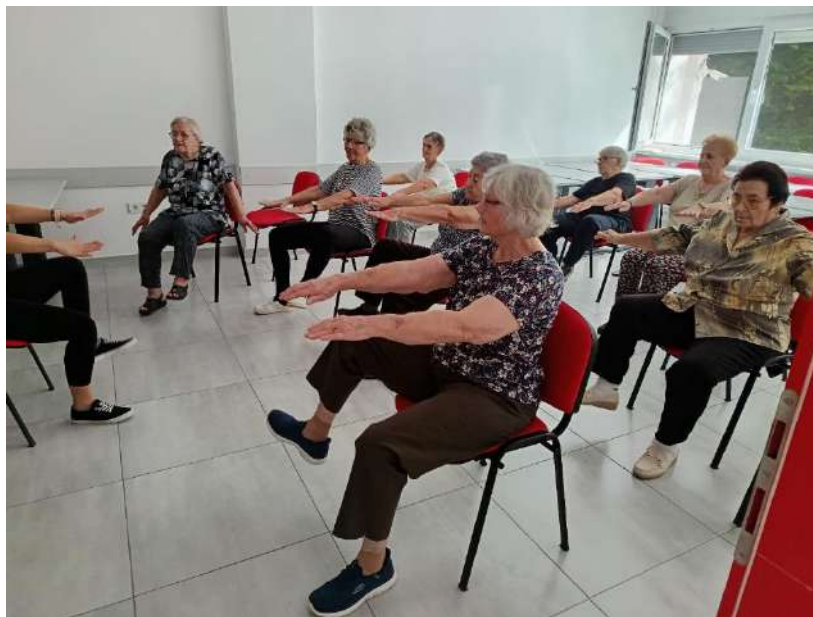
Slika 28 Tjelovježba za osobe starije životne dobi

Korisnici Dnevnog boravka Crvenog križa Valpovo najveći su interes pokazali za radionice usmjerene na očuvanje zdravlja korisnika: redovite vođene tjelovježbe za osobe starije životne dobi, koje su se održavale svake srijede, te aktivnosti mjerenja krvnog tlaka i glukoze u krvi, koje su održavale svakog četvrtka u Dnevnom boravku Crvenog križa Valpovo.