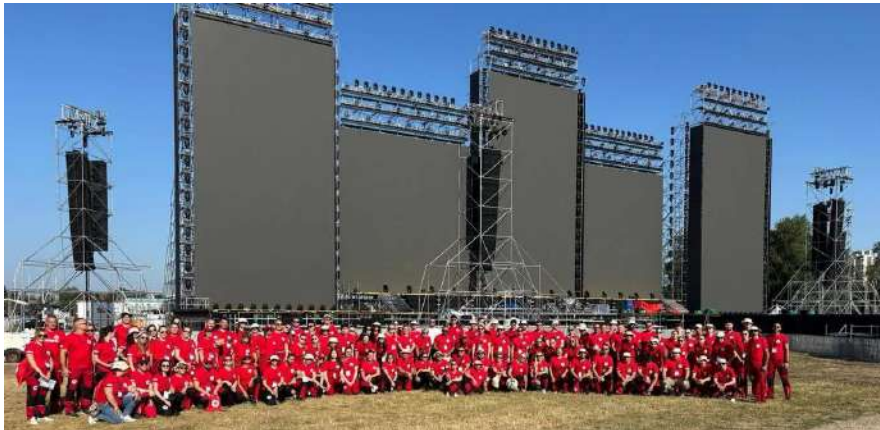
Slika 8 Dežurstvo na zagrebačkom Hipodromu 2025. godine

Đakovačko-osječke nadbiskupije, proslavi obljetnice krunjenja Majke Tripud Divne, stolnoteniskom turniru, obilježavanju dana hrvatskih branitelja grada Belišća, Ljetu valpovačkom, županijskom vatrogasnom natjecanju, Volonteri i zaposlenici GDCK Valpovo sudjelovali su i na dežurstvu na SeaStar festivalu u Umagu kao pomoć volonterima i zaposlenicima GDCK Buje te je jedna volonterka sudjelovala na dežurstvu tijekom jednog od najvećih glazbenih događaja održanih na zagrebačkom Hipodromu.