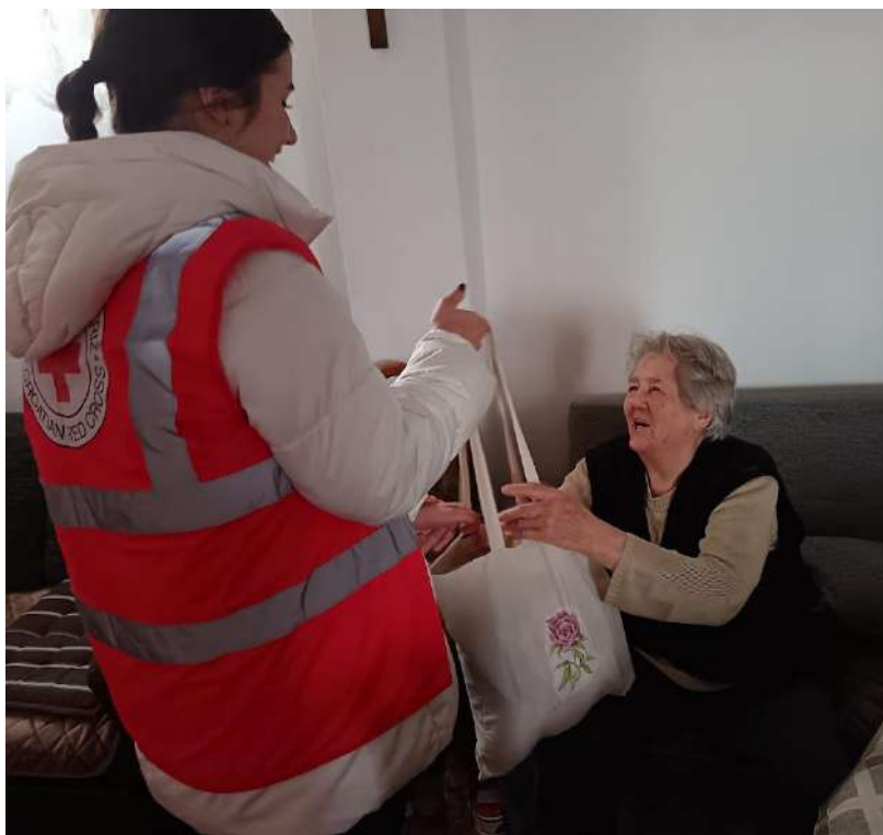
Slika 1 Volonterka i korisnica Pomoći u kući

Djelujući u skladu s temeljnim načelima Međunarodnog pokreta Crvenog križa i Crvenog polumjeseca, Hrvatski Crveni križ Gradsko društvo Crvenog križa Valpovo potiče dobrovoljnost i solidarnost, štiti dostojanstvo, život i zdravlje te bez diskriminacije pomaže čovjeku u potrebi 2 .