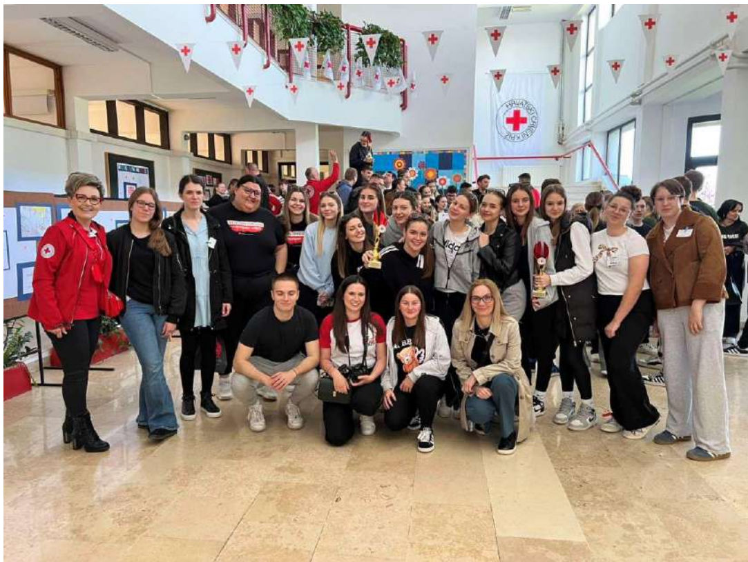
Slika 27 Ekipa iz kategorije podmladak OŠ Ladimirevci, ekipa iz kategorije mladih SŠ Valpovo, volonteri i zaposlenici GDCK Valpovo na Međužupanijskom natjecanju mladih HCK 2025. godine

Na međužupanijskoj razini koja je održana 12. travnja 2025. godine u Slatini, ekipa Srednje škole Valpovo osvojila je 3. mjesto u kategoriji mladih dok je ekipa OŠ Ladimirevci osvojila 3. mjesto u kategoriji podmlatka.