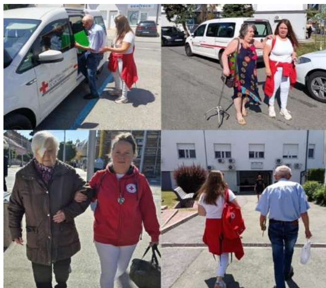
Slika 34 Mobilni uz nas - Crveni križ Valpovo

Projekt se provodi uz financijsku podršku Ministarstva rada, mirovinskog sustava, obitelji i socijalne politike, u partnerstvu s lokalnim jedinicama vlasti, a korisnici ga koriste redovito, uključujući i situacije kada volonteri GDCK Valpovo pružaju dodatnu pomoć pri dolasku i odlasku. Kroz ovu uslugu, Crveni križ osigurava da starije osobe imaju siguran, pouzdan i prijateljski pristup potrebnim uslugama, čime se jača njihova povezanost s lokalnom zajednicom i osjećaj sigurnosti. Tijekom 2025. godine 190 korisnika je koristilo uslugu prijevoza.