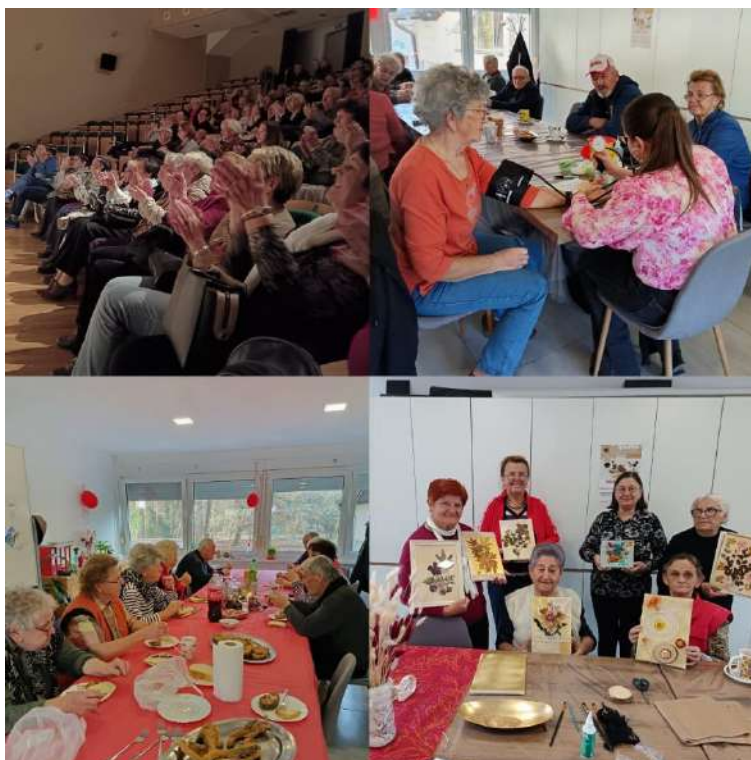
Slika 47 Dnevni boravak - Crveni križ Valpovo

Valpovštine. Provodile su se sportsko-rekreativne, kreativne, edukacijske i informativne radionice, kulturne i zabavne aktivnosti te kombinacija svega navedenog.