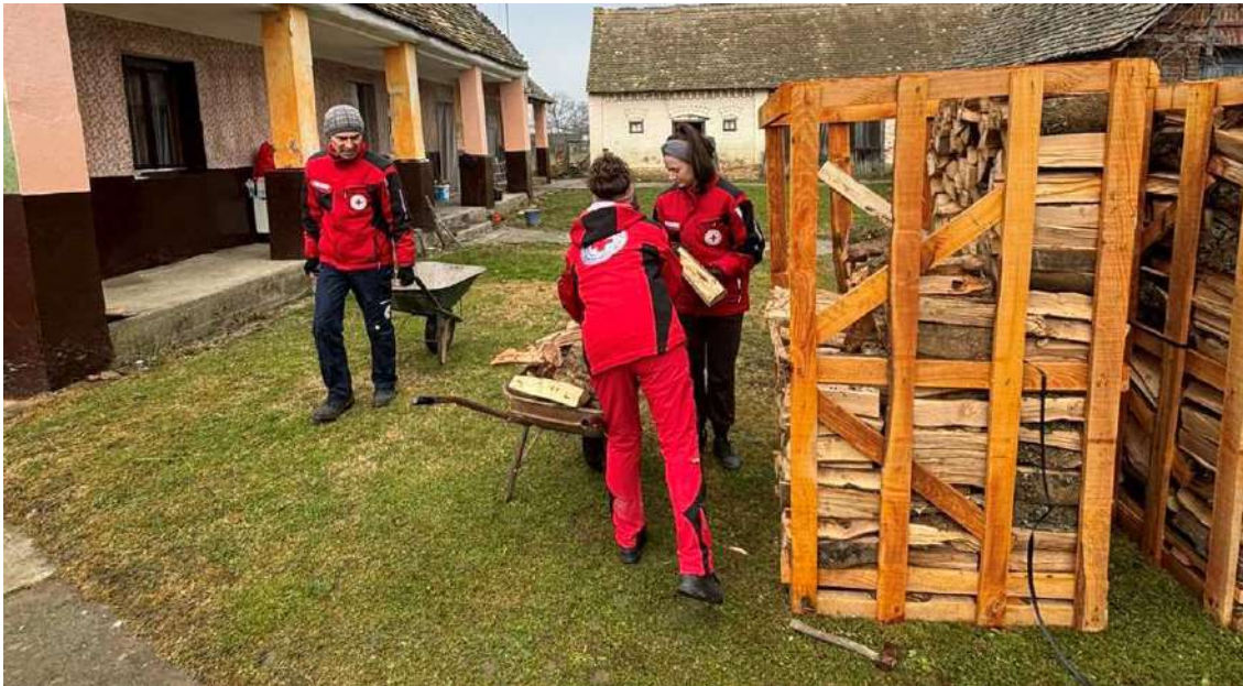
Slika 35 Pomoć u kući