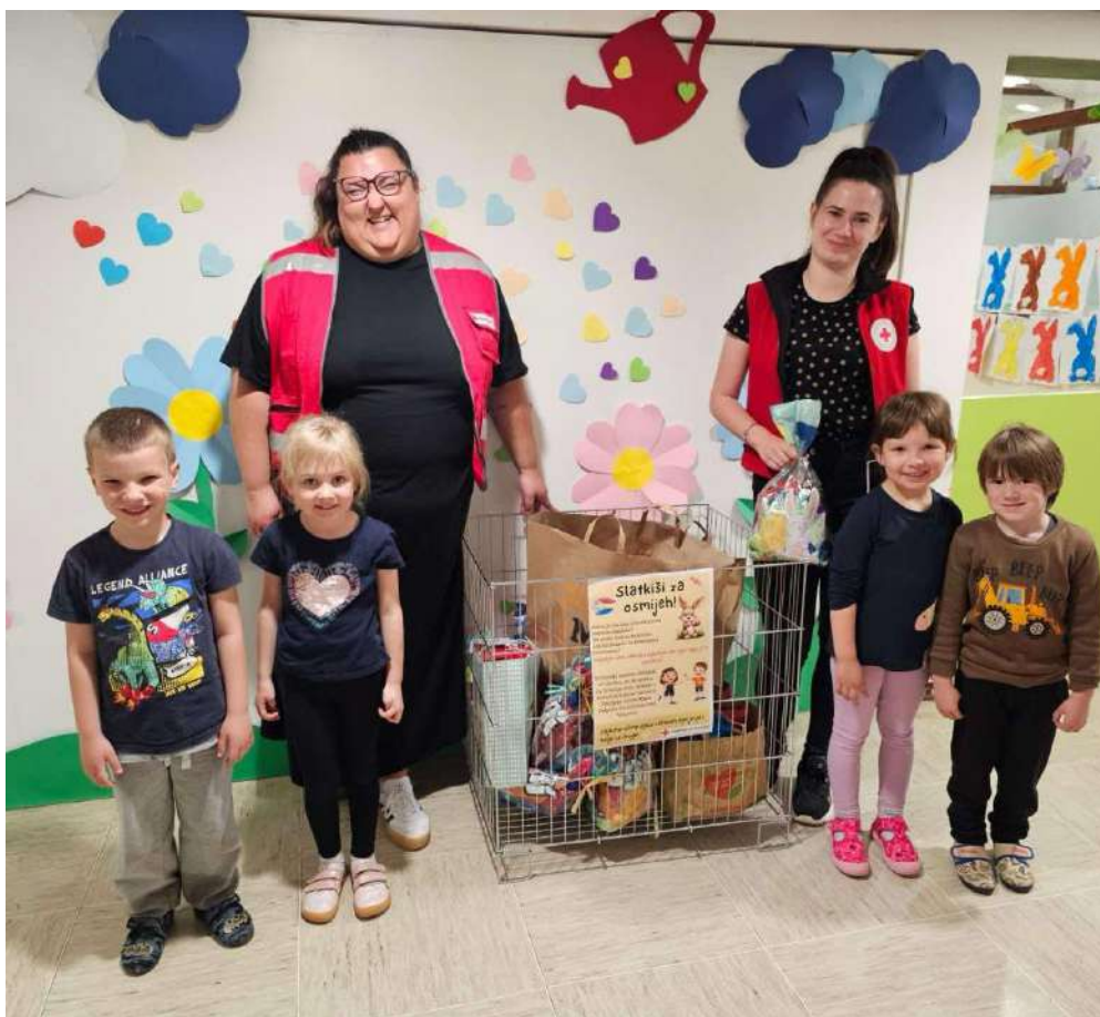
Slika 41 Donacija - Dječji vrtić Maza Valpovo

Registar posrednika u lancu doniranja hrane vodi Ministarstvo poljoprivrede, šumarstva i ribarstva, a u Registar moraju biti upisane sve pravne osobe koje namjeravaju obavljati poslove posrednika u lancu doniranja hrane. Kroz program Hrvatskog Crvenog križa „Za dostojanstven život“ kupljena su i podijeljena drva za ogrjev osobama starije životne dobi. Ova pomoć osigurava toplinu i osnovne uvjete za grijanje onima kojima je najpotrebnije.