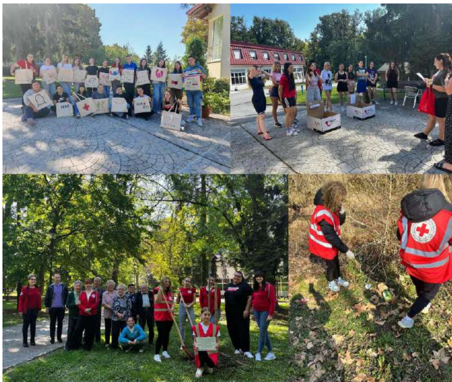
Slika 22Aktivnosti u okviru projekta ESS "Educiraj, prenesi, zelenije sutra donesi" 2025. godine

Mladi GDCK Valpovo veliko iskustvo imaju i u provedbi projekata financiranih od strane Agencije za mobilnost i programe EU iz programa Europskih snaga solidarnosti. Tijekom prve polovice 2025. godine proveli su projekt „Educiraj, prenesi, zelenije sutra donesi“, koji je financiran sredstvima Europske unije iz programa Europskih snaga solidarnosti. U okviru projekta provedene su brojne edukativne i praktične aktivnosti usmjerene na podizanje svijesti o klimatskim promjenama i poticanje održivih ponašanja kao i početna i završna anketa koje su pokazale značajan porast razine znanja i osviještenosti sudionika, pri čemu se udio ispitanika koji nisu bili svjesni utjecaja vlastitih aktivnosti na klimatske promjene smanjio s 47,2 % na 6,1 %, a više od 90 % sudionika navelo je da stečena znanja primjenjuje u svakodnevnom životu. Tijekom projekta održane su dvije edukacije za mlade s ukupno 31 sudionikom, provedeno je 25 radionica u školama i vrtićima s ukupno 421 sudionikom, izrađeni su digitalni i tiskani informativni letci o zaštiti od vrućina (100 primjeraka), organizirana radionica „Moj ugljični otisak“, provedena akcija čišćenja okoliša, održan edukativni pub kviz te realizirana sadnja stabala u suradnji s Gradom Valpovo, čime je ostvaren cilj projekta jačanja znanja, odgovornosti i aktivnog sudjelovanja djece, mladih i šire zajednice u području zaštite okoliša.