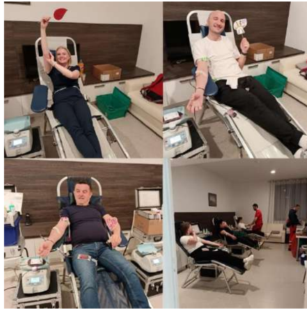
Slika 11 Akcije DDK Bizovac

Obavijesti kojima su se pozivali građani na akcije DDK, a koje je pripremala stručna služba Gradskog društva Crvenog križa Valpovo, objavljivane su i putem Hrvatskog radija Valpovštine, Gradskog radija Belišće, portala www.valpovstina.info , službene Web i Facebook stranice GDCK Valpovo te Instagram profila društva. Osim pozivanja davatelja na akcije DDK, napravljeni su različiti videozapisi kao i ostale objave kako bi animirale potencijalne, ali i zahvalili dosadašnjim dobrovoljnim davateljima koji kontinuirano daruju krvi. Objave se nalaze na prethodno spomenutim stranicama, ali i na rastućoj društvenoj mreži - Tik Tok.