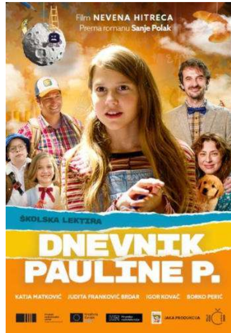
Slika 2. najgledaniji hrvatski film u 2023.