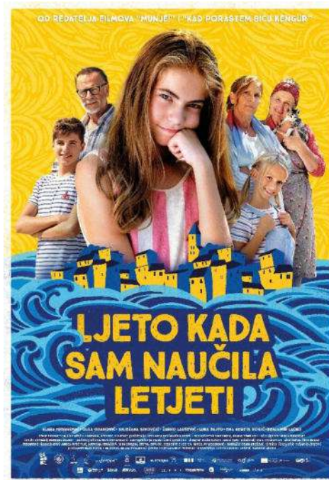
Slika 4. najgledaniji film iz regije