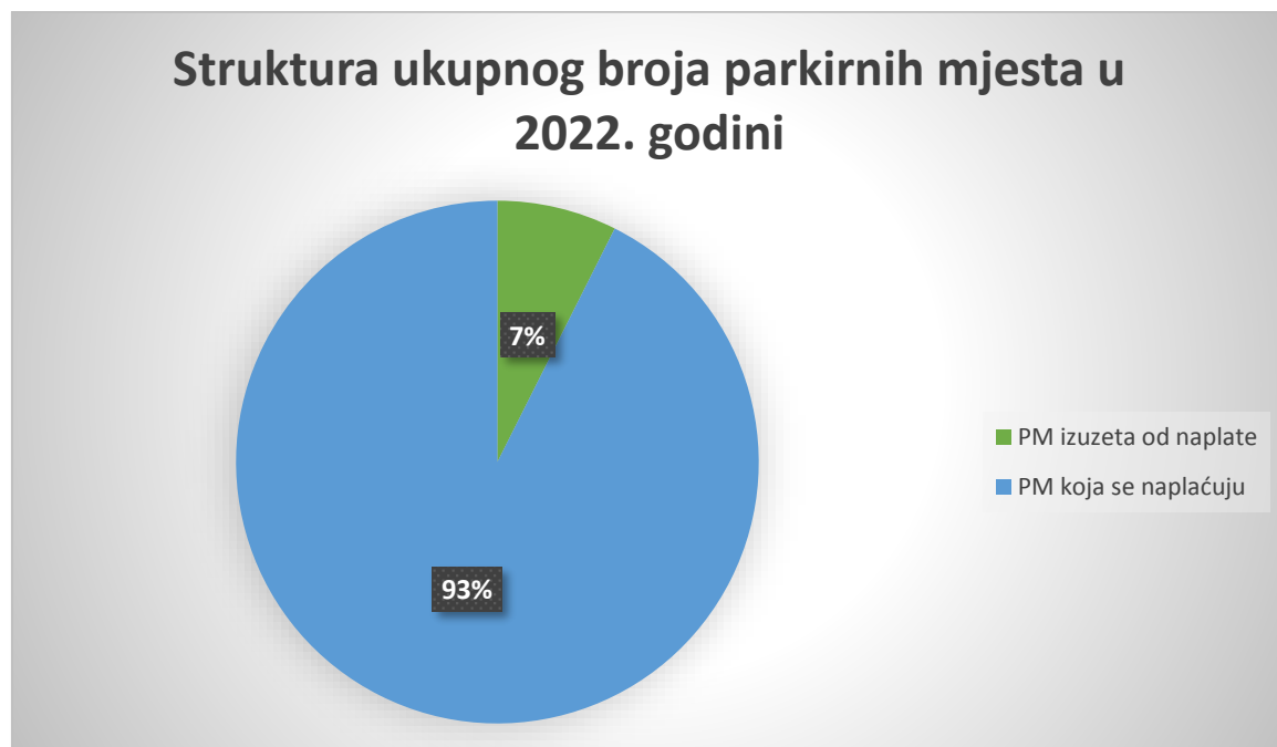
Grafikon 1. Struktura naplate parkiranja