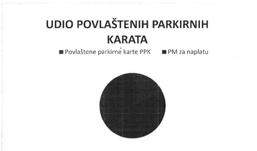
Grafikon 3. Udio povlaštenih parkirnih karata na ukupan broj PM

Koeficijent povlaštenih parkirnih karata u odnosu na ukupan broj parkirnih mjesta iznosi 0,18.